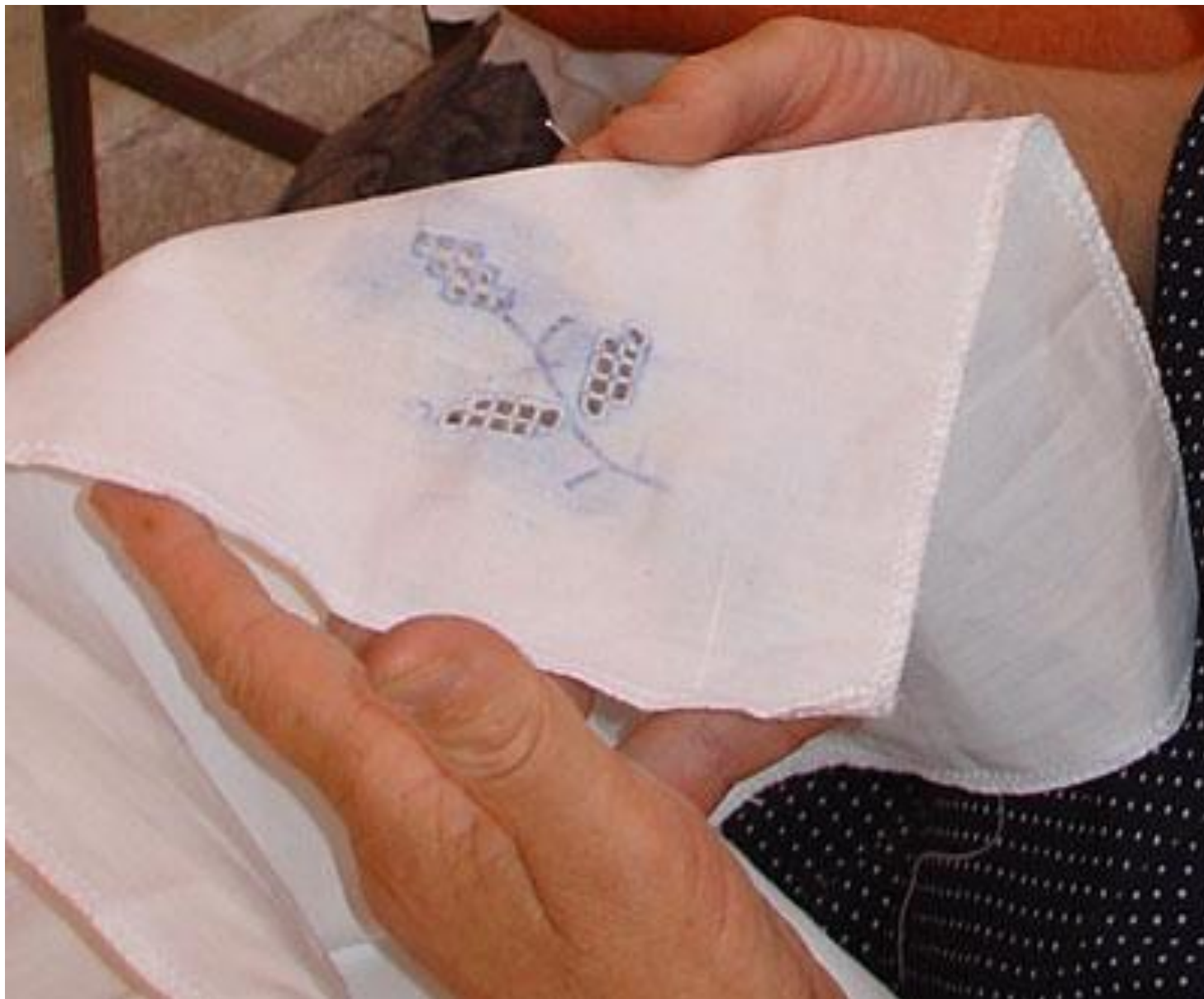
Štikanje – detalj.