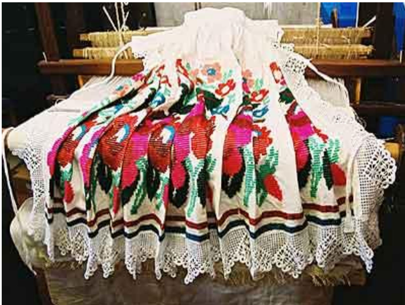
Primjer tkanja na "daščici".