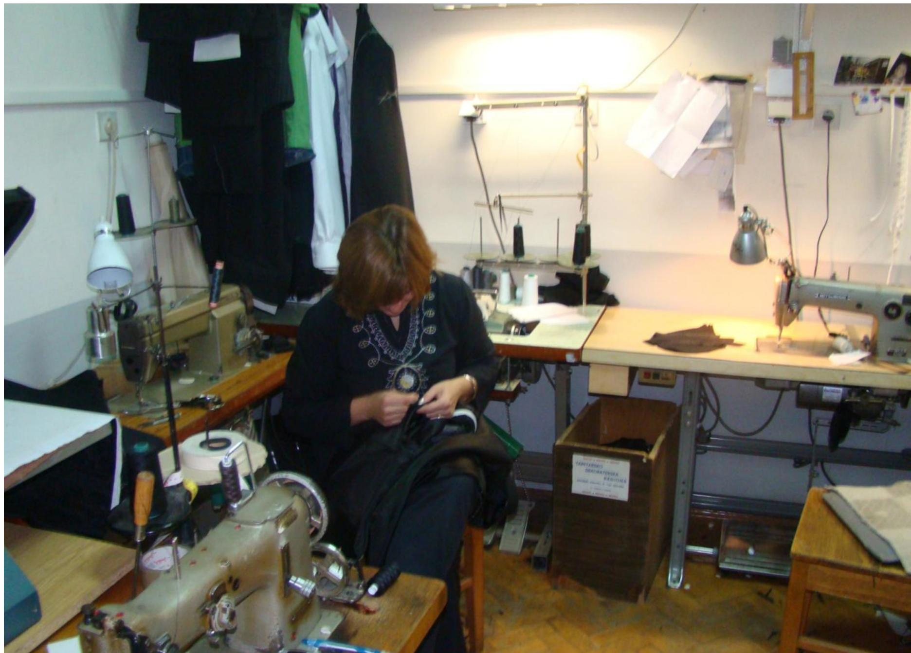
“Alati” korišteni u krojačkoj radionici: krojača mašina, konac, igla i vrijedne ruke.