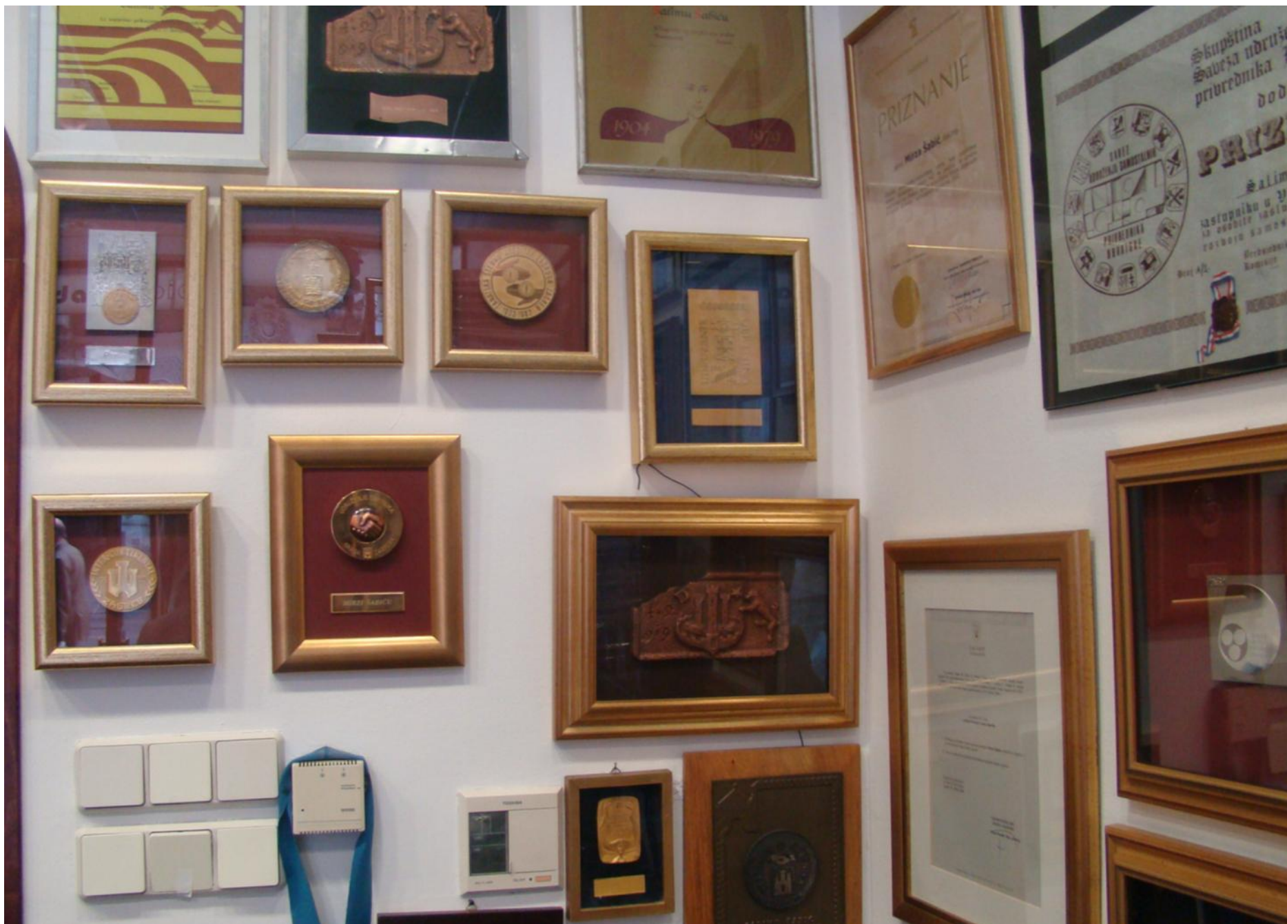
Razna priznanja i nagrade obrtu "Šabić" u dugogodišnjem uspješnom radu.