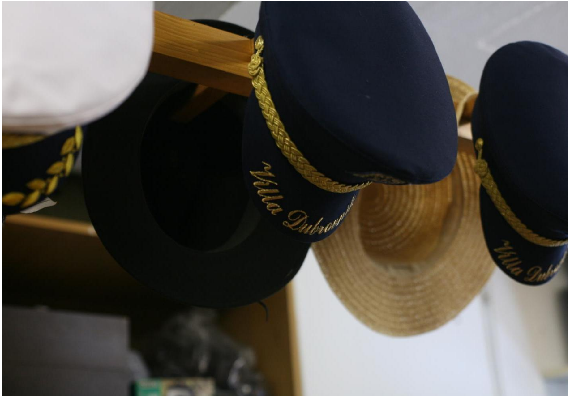
Tradicionalni šeširi za sva podneblja Hrvatske.