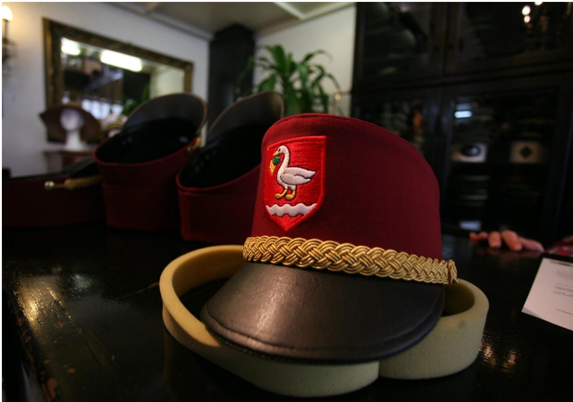
Kape izrađene po narudžbi i za posebne namjene prepoznatljive su kvalitete.