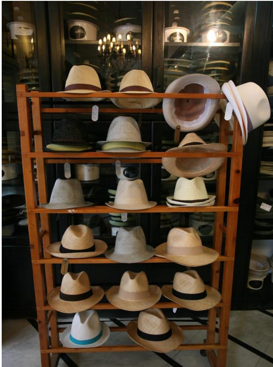
Muški elegantni šiširi.