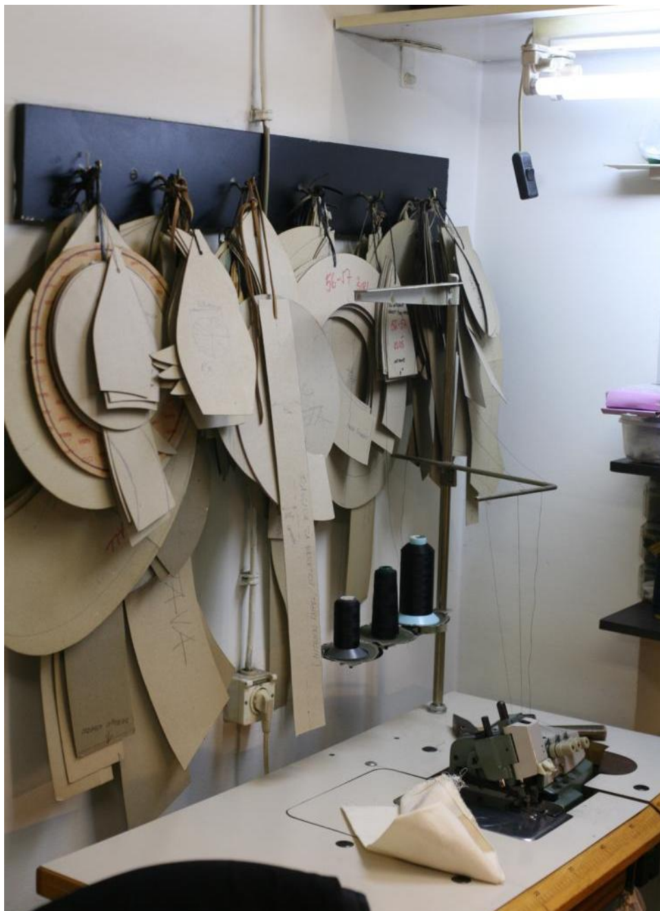
Razni kalupi i krojevi za šešire.