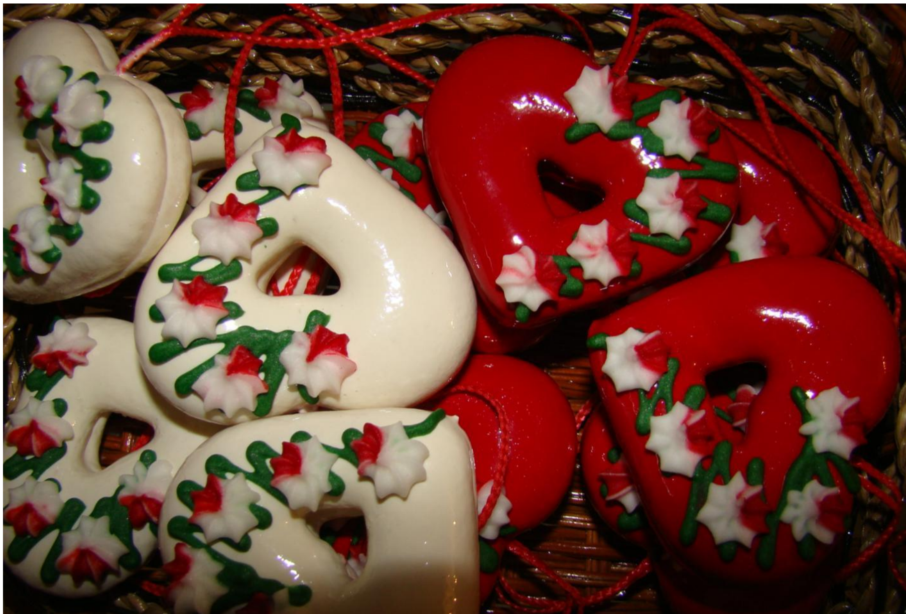
Licitar je šareno ukrašeni kolač od medenog tijesta čiju tajnu izrade čuvaju obiteljski obrti medicara kontinentalne Hrvatske.