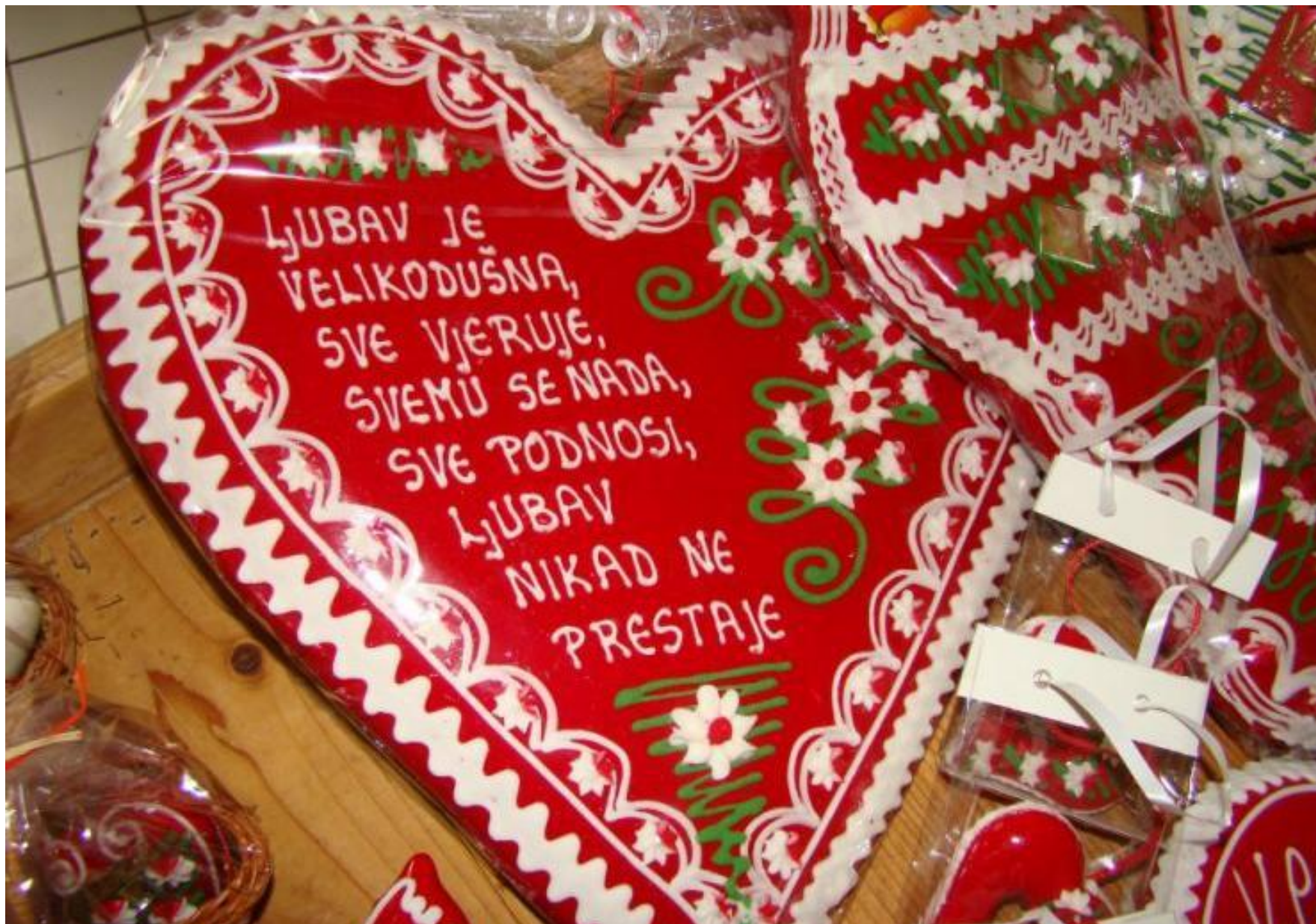
Licitari obrta "Bičak" prepoznatljivi su po dimenzijama (koje su nešto veće od uobičajenih) te po izrekama i aforizmima koji su aplicirani na površinu licitara, a vezani su uz tematiku ljubavi.