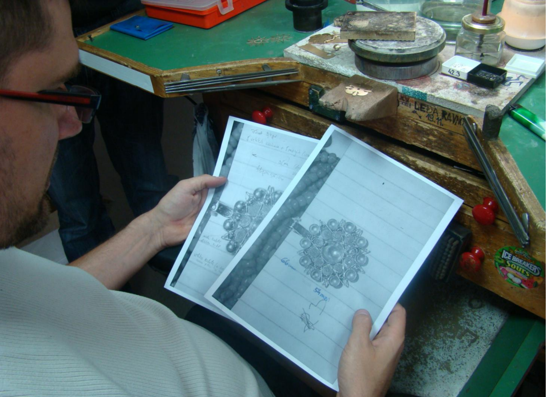
Zaposlenik pregledava nacрте za nakit koji će se u zlatarnici "Križek" tek proizvesti.