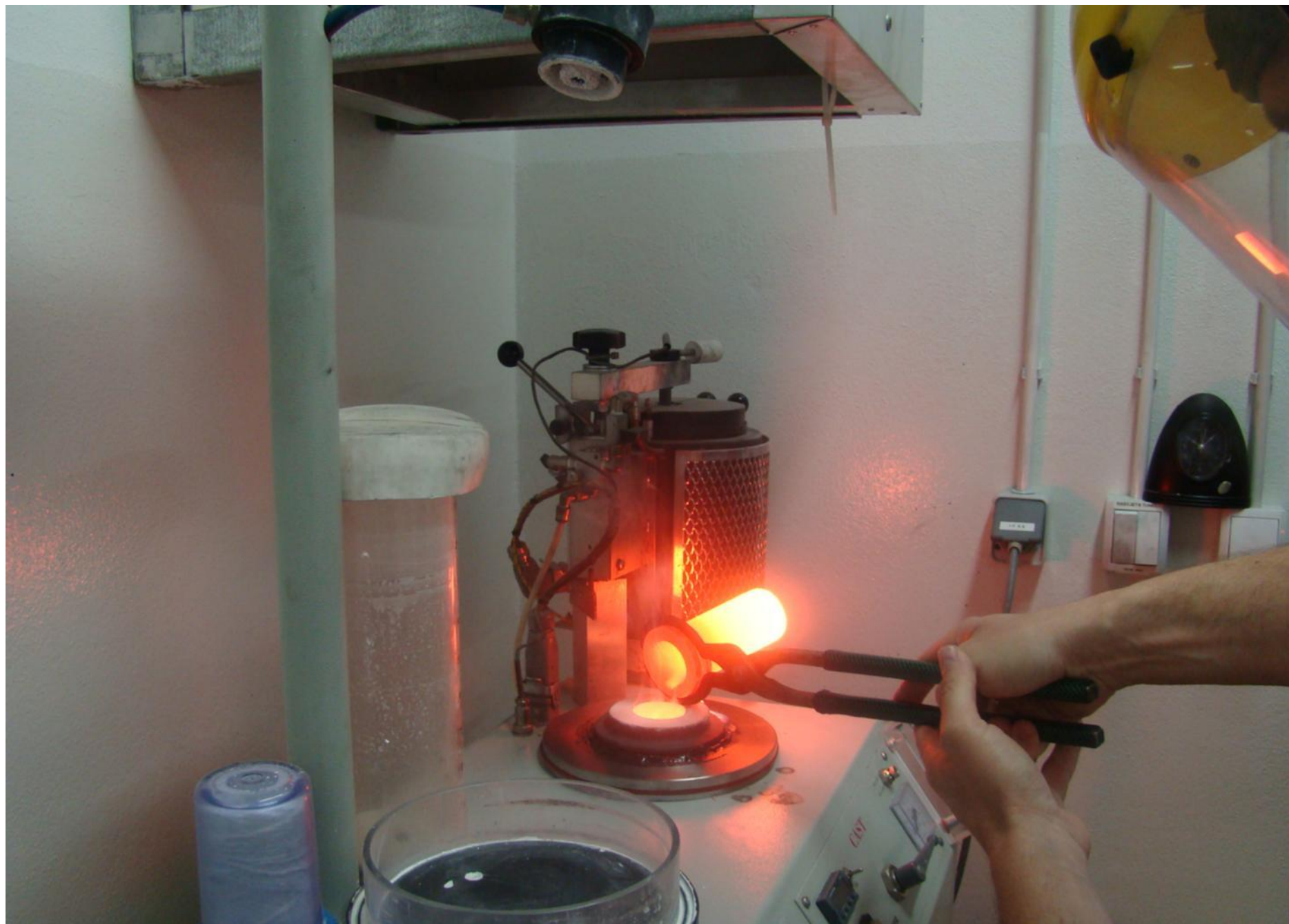
Lijevanje zlata. Točka taljenja je 1064 C.