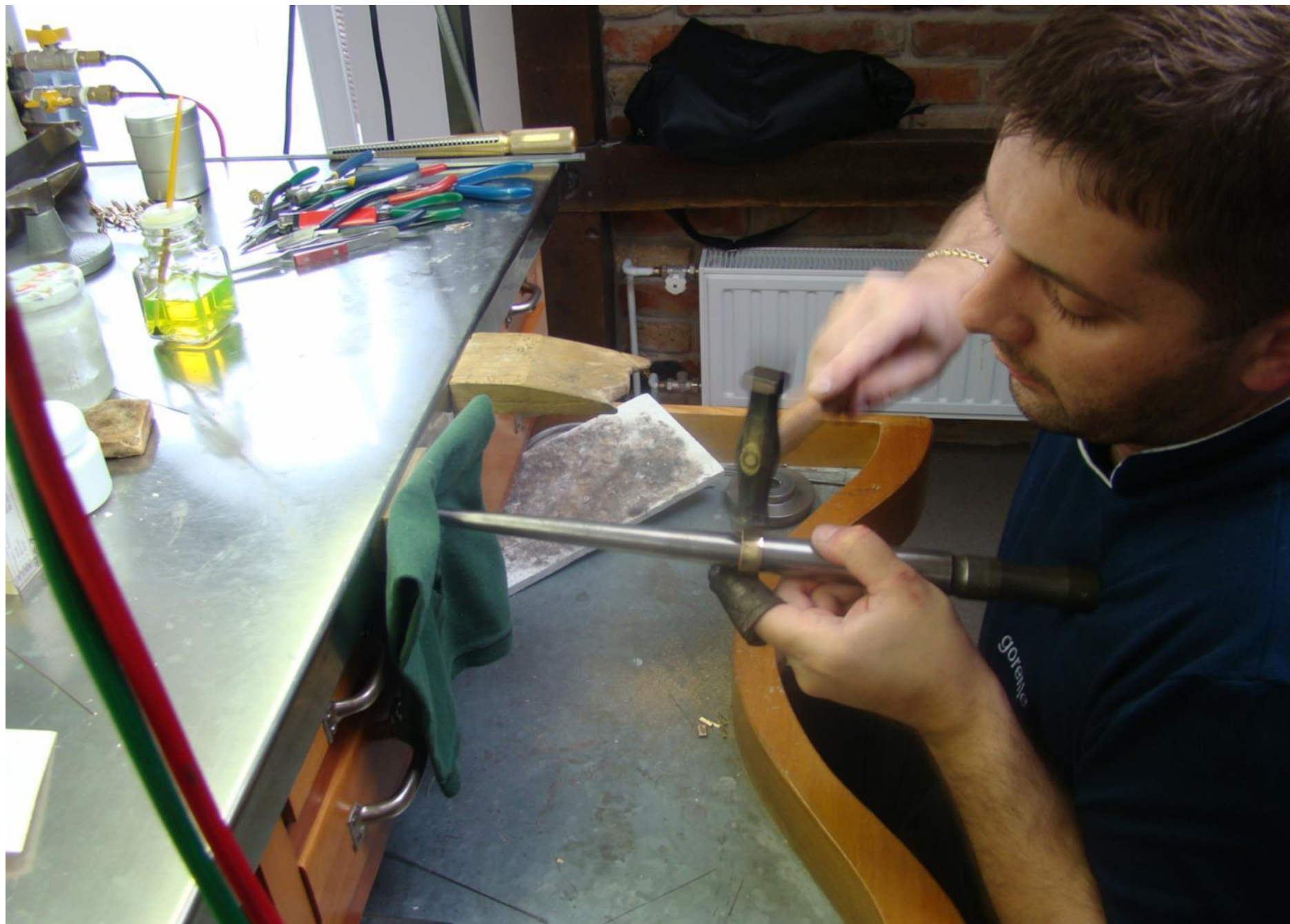
Finije oblikovanje zlata takozvanim "kuckanjem".