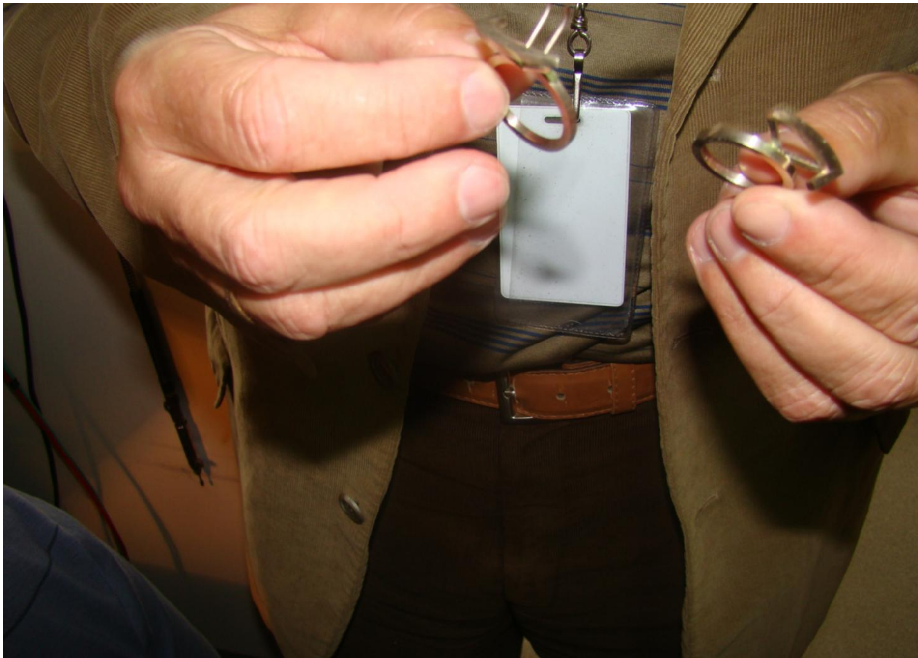
Na slici – osnovni dijelovi prstena koji se nalazi u završnoj fazi dorade dizajna.