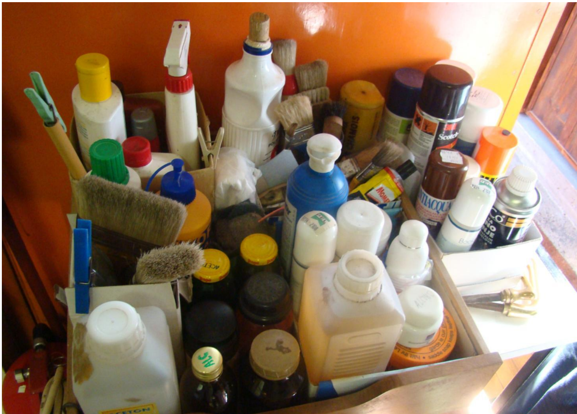
Pri konzerviranju arhivske građe koristi se velika količina raznih kemikalija.