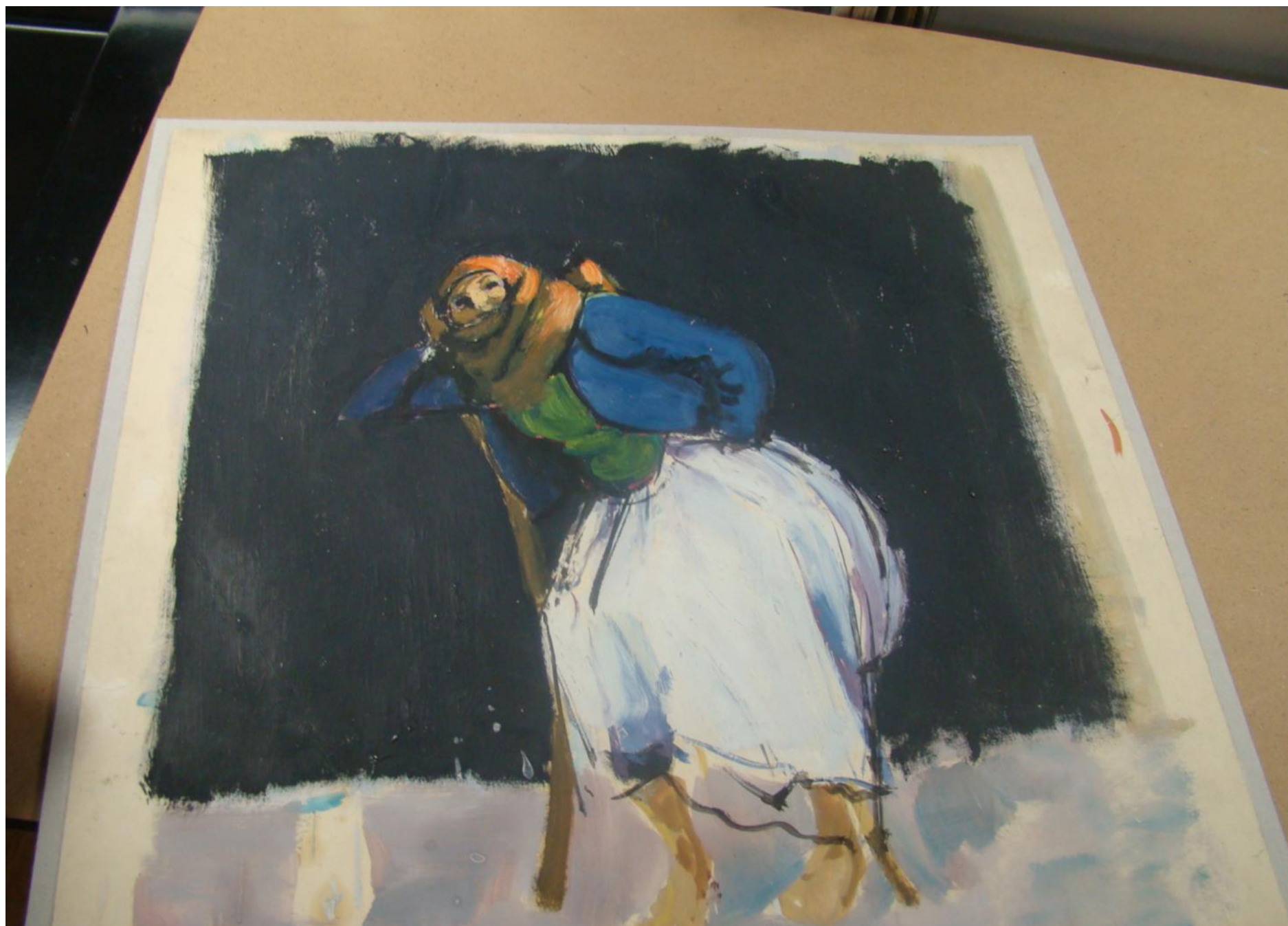
Među građom na očuvanju koje se radi u radionici "Konzervator" Irene Medić nalaze se slike..