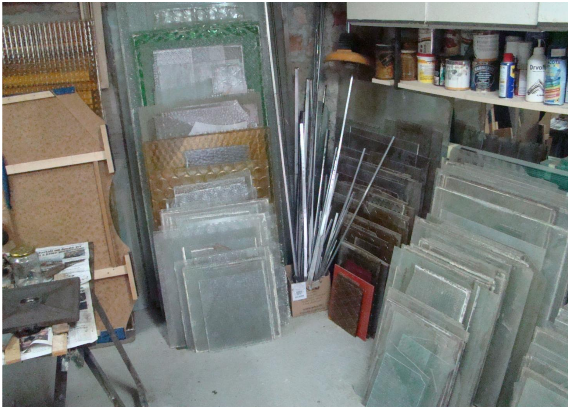
Osim izrade vitraja, u Obrtu "Staklič" se obrađuju i sve vrste stakla.