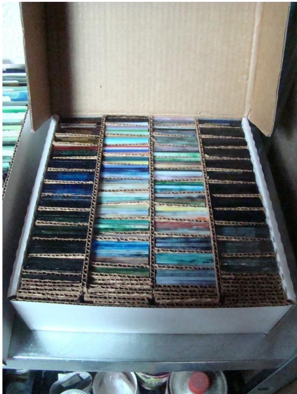
Različiti uzorci stakla.