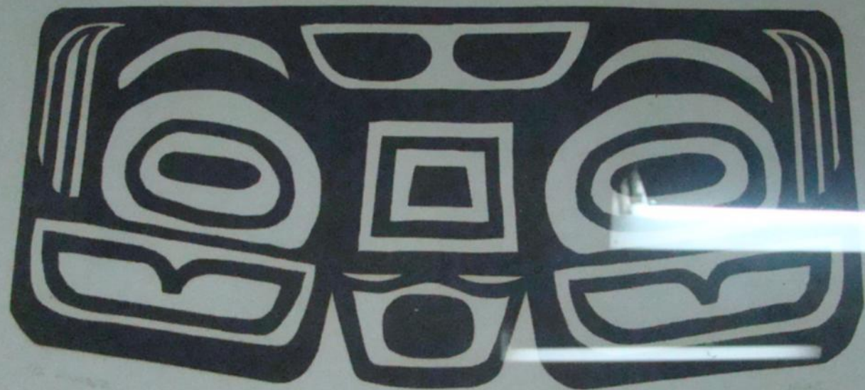
Na slici – linorez "Maska"