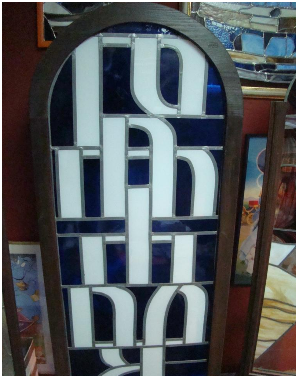
Radovi Dominique Jurić plijene pozornost visokom kreativnošću i osjećajem za prostor. Na slici rad "Plavo" (glagoljica).