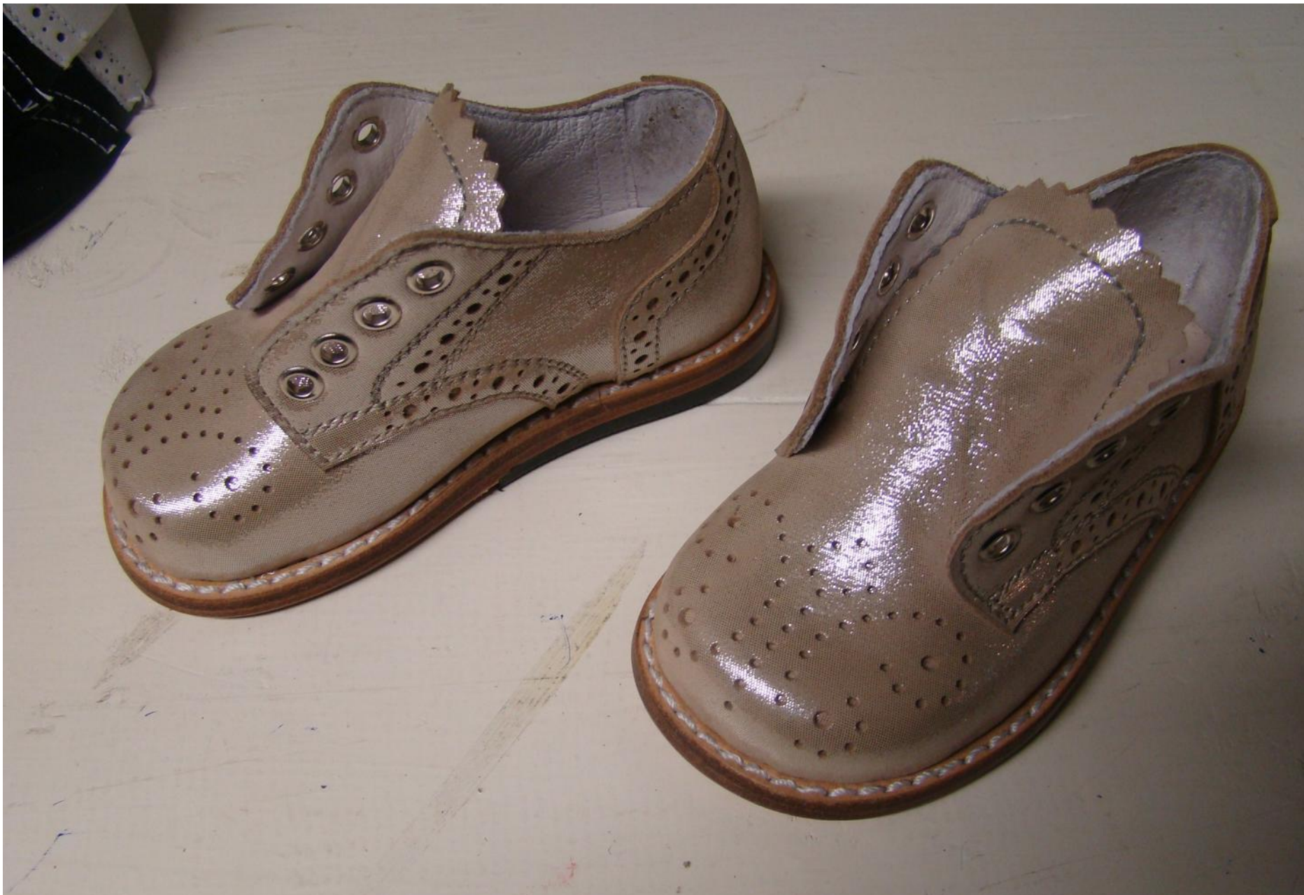
Svečane dječje cipelice, ponos su obrta Valek – njihov svaki dio obrađen je ručno i s velikom pažnjom.